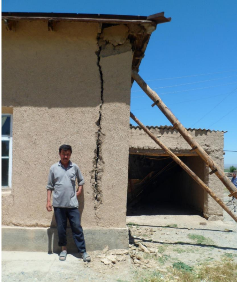
Фото 2. Отход торцевой стены индивидуального дома в кишлаке Бустан, Галлааральский район, Джизакская область, 2013 г.