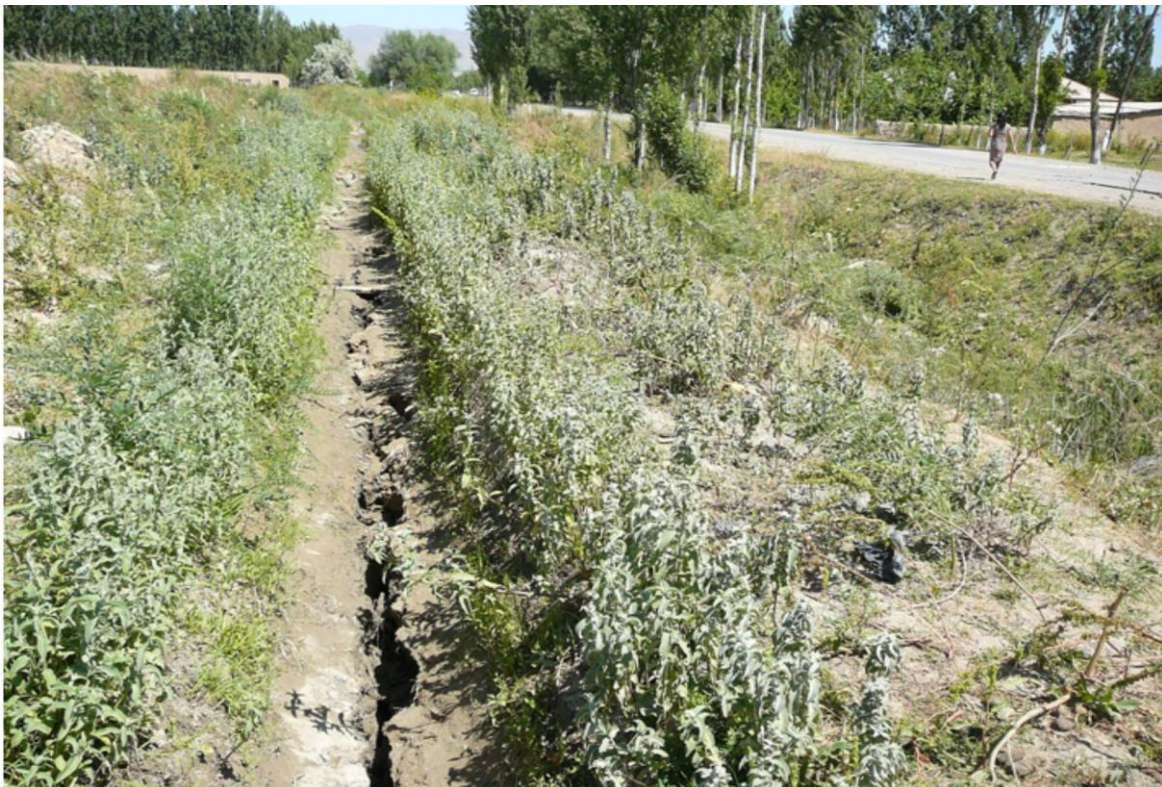
Фото 5. Зияющая трещина шириной 5–10 см на дне арыка, 2013 г.