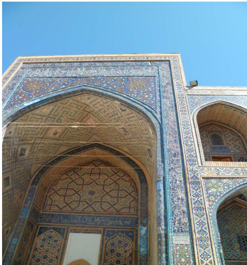
Фото 7 в. Выпадение плиток изразцов, вертикальные нитяные трещины на портале мавзолея Гур-Эмир, г. Самарканд, 2013 г.