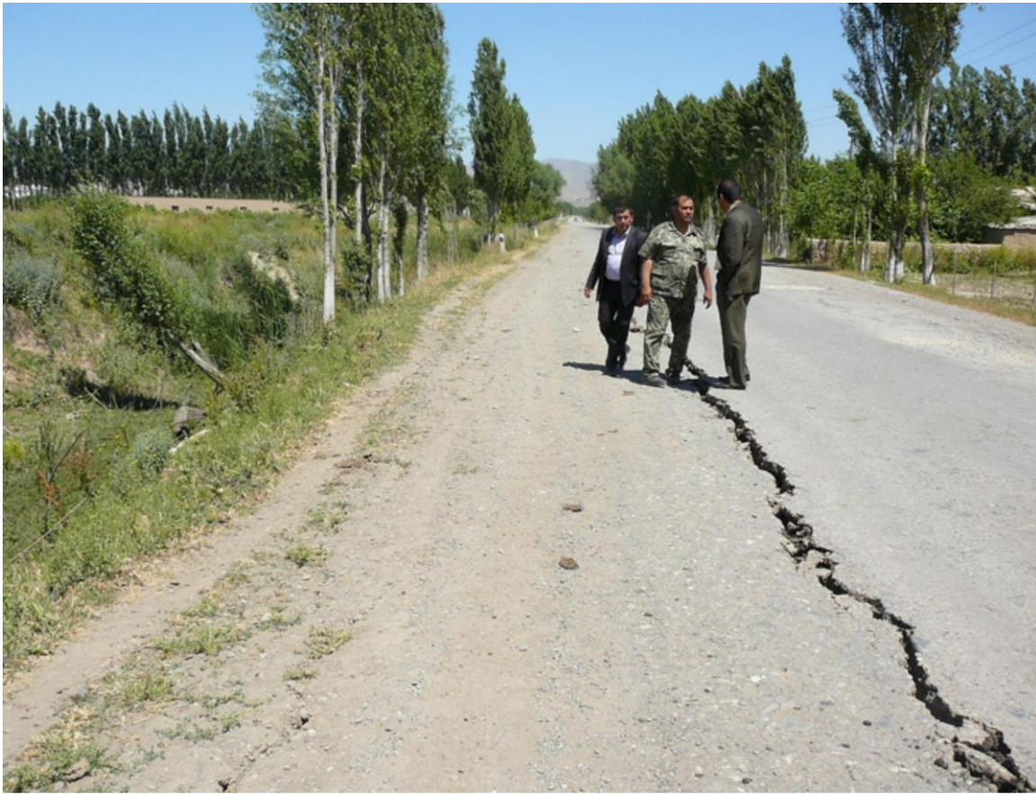
Рис. 4. Зияющая трещина, возникшая на асфальтовом покрытии дороги в кишлаке Пахтабоши, Галлааральский район, Джизакская область, 2013 г.