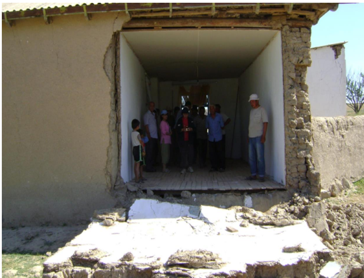
Фото 1. Обвал стены индивидуального дома в кишлаке Кутал, Галлааральский район, Джизакская область, 2013 г.