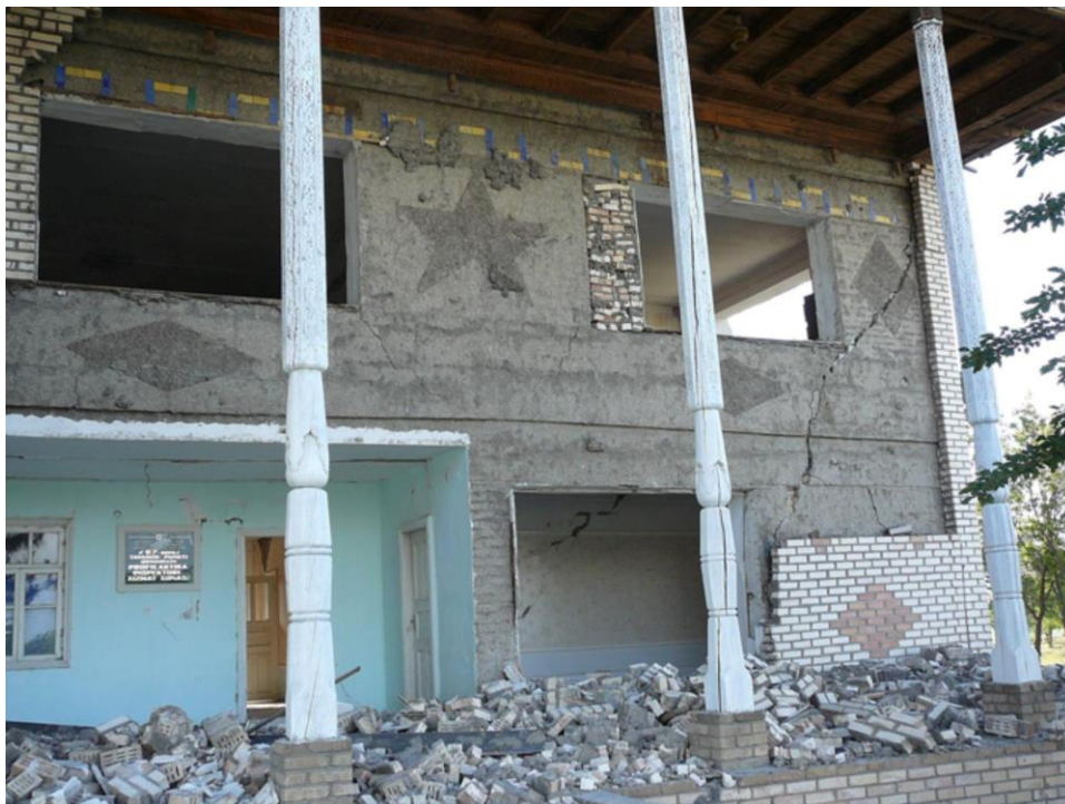
Фото 3. Состояние здания ОВД Галла-Аральского района Джизакской области после воздействия Маржанбулакского землетрясения, 2013 г.