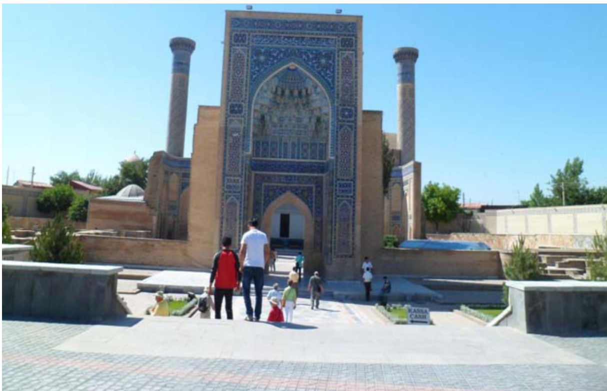
Фото 7 а. Узбекистан, г. Самарканд, мавзолей Гур-Эмир, 2013 г.