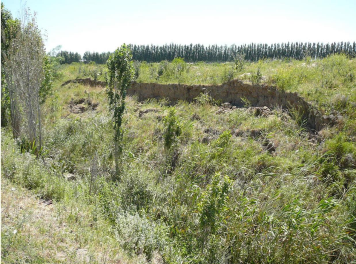
Фото 6. Смещение побережья коллектора в кишлаке Пахтабоши, Галлааральский район, Джизакская область, 2013 г.