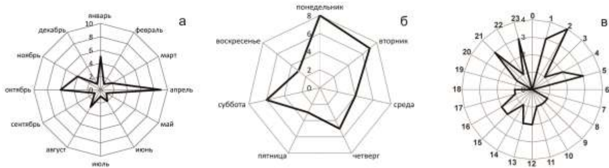
Рис. 2. Лепестковые диаграммы распределения землетрясений Арктического региона по месяцам (а), дням недели (б) и часам суток (в)

В распределении событий по месяцам отмечается максимум в апреле (рис. 3 а), по дням недели лидируют понедельник, вторник, четверг и суббота (рис. 2 б), по времени суток незначительное повышение в 02 h и отсутствие 00 h , 06 h , 07 h , 19 h (рис. 2 с).